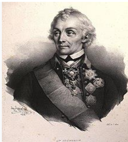
Полководец А. В. Суворов. Литография 1828 г.

В 1790 году Южная армия Г. А. Потёмкина , одержав ряд побед, приблизилась к Измаилу — наиболее мощной крепости на левом берегу Дуная, укрепленной по последним требованиям крепостного искусства и считавшуюся неприступной. Осада Измаила затянулась. Потёмкин так и не смог взять крепость и поручил дальнейшую осаду Суворову , прибывшему в русский лагерь 2 (13) декабря 1790 года.