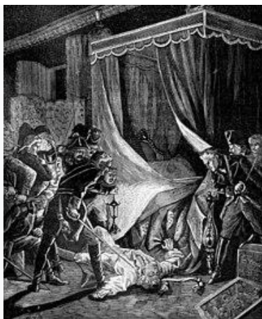
Убийство императора Павла I (французская гравюра, 1880-е годы)

Активными участниками убийства, представленными в этой главе книги, были Кутайсов И.П., Аракчеев А.А., Зубов Н.А., Пален П., Беннигсен Л.